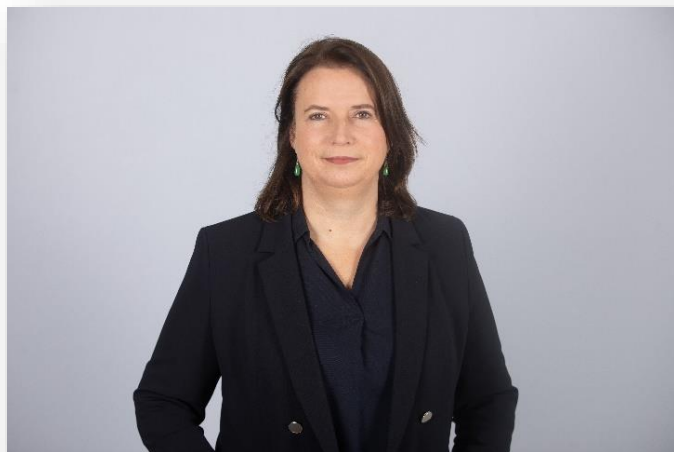
Claire Hédon, défenseure des droits