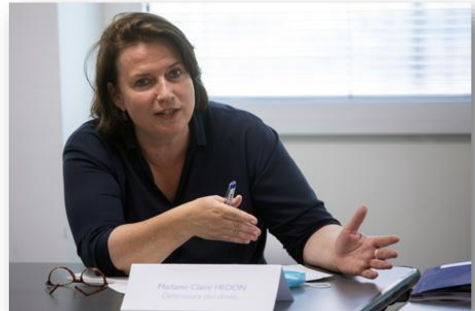
Claire Hédon, défenseure des droits, en déplacement à Bobigny